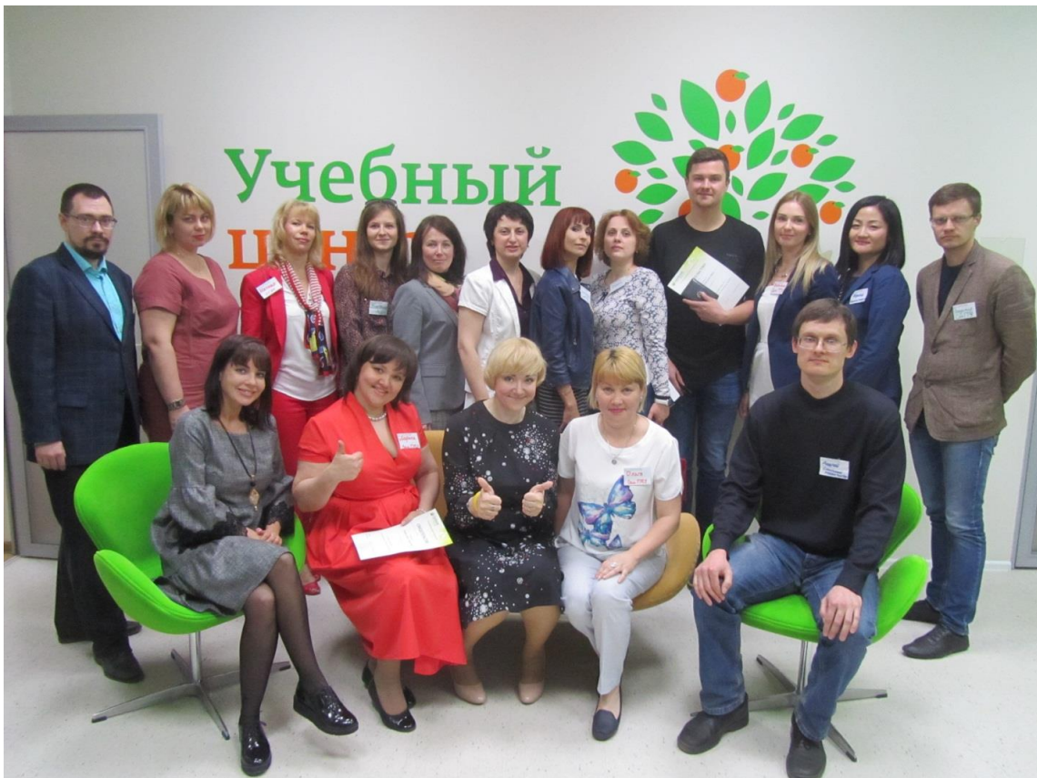
Совместная фотография слушателей, 20 мая, 2017 г.