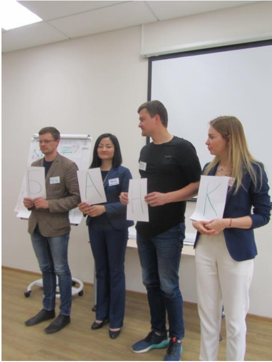
Преподаватели дружественных кафедр Самарского государственного технического университета